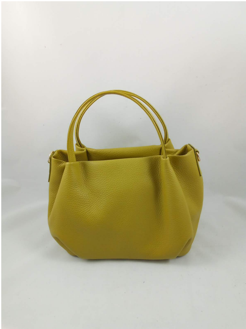
MINI LILOU CEDRO